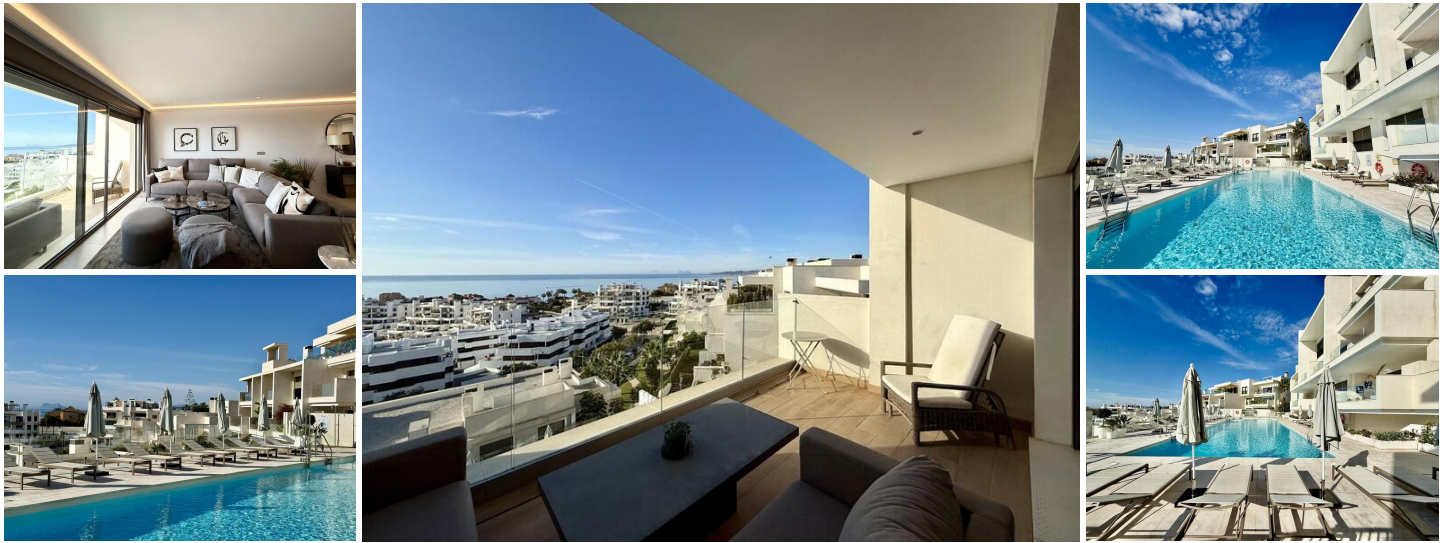
Oslagbar Utsikt i Estepona – Modernt Lägenhet med 3 Sovrum och 3 Badrum

Upptäck enastående panoramautsikt över havet och bergen från denna rymliga lägenhet med 3 sovrum och 3 badrum, perfekt belägen i det eftertraktade området Las Mesas i Estepona. Med en fantastisk vy över kusten, Gibraltar och Marocko erbjuder denna vackra bostad en lugn men bekväm plats, strax ovanför Esteponas småbåtshamn, inom gångavstånd eller en kort bilresa från Gamla Stan, stranden och den livliga nya strandpromenaden.