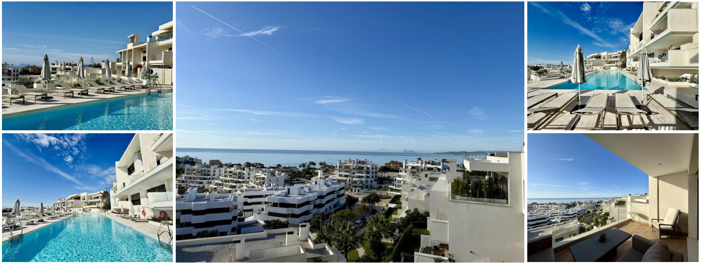
Oslagbar Utsikt i Estepona – Modernt Lägenhet med 3 Sovrum och 3 Badrum

Upptäck enastående panoramautsikt över havet och bergen från denna rymliga lägenhet med 3 sovrum och 3 badrum, perfekt belägen i det eftertraktade området Las Mesas i Estepona. Med en fantastisk vy över kusten, Gibraltar och Marocko erbjuder denna vackra bostad en lugn men bekväm plats, strax ovanför Esteponas småbåtshamn, inom gångavstånd eller en kort bilresa från Gamla Stan, stranden och den livliga nya strandpromenaden.