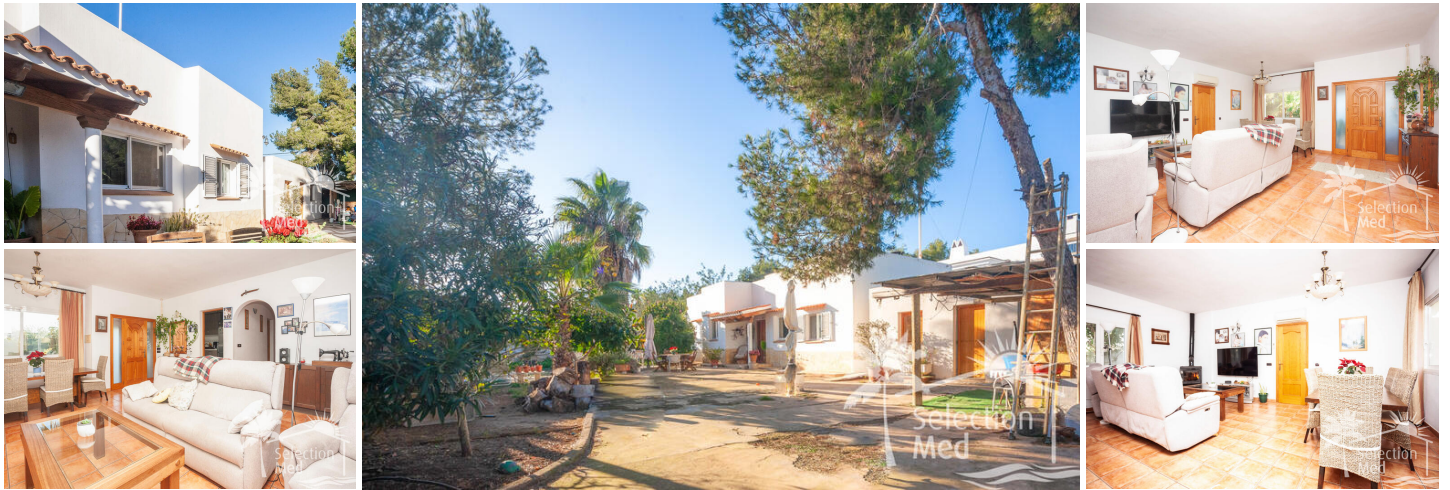
Fristående hus beläget i S. Eularia des Riu

Hus beläget på en stadsplanerad tomt på 800 m 2 , helt inhägnad med mur och staket, beläget i ett mycket lugnt och privilegierat område i Santa Eularia des Riu, mycket nära de bästa stränderna, restaurangerna, barerna och strandklubbarna i området.