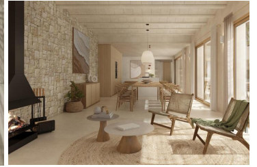
NYBYGGD VILLA I CALPE MED HAVSUTSIKT

Nybyggd lyxvilla belägen i utkanten av Calpes stadsområde, bredvid en medelhavs tallskog med utsikt över klippan, som du aldrig kommer att se på samma sätt efter att ha känt till dess legend. På varma sommarnätter kommer du att komma ihåg den här historien och vara tacksam för livets gåva i Medelhavet.