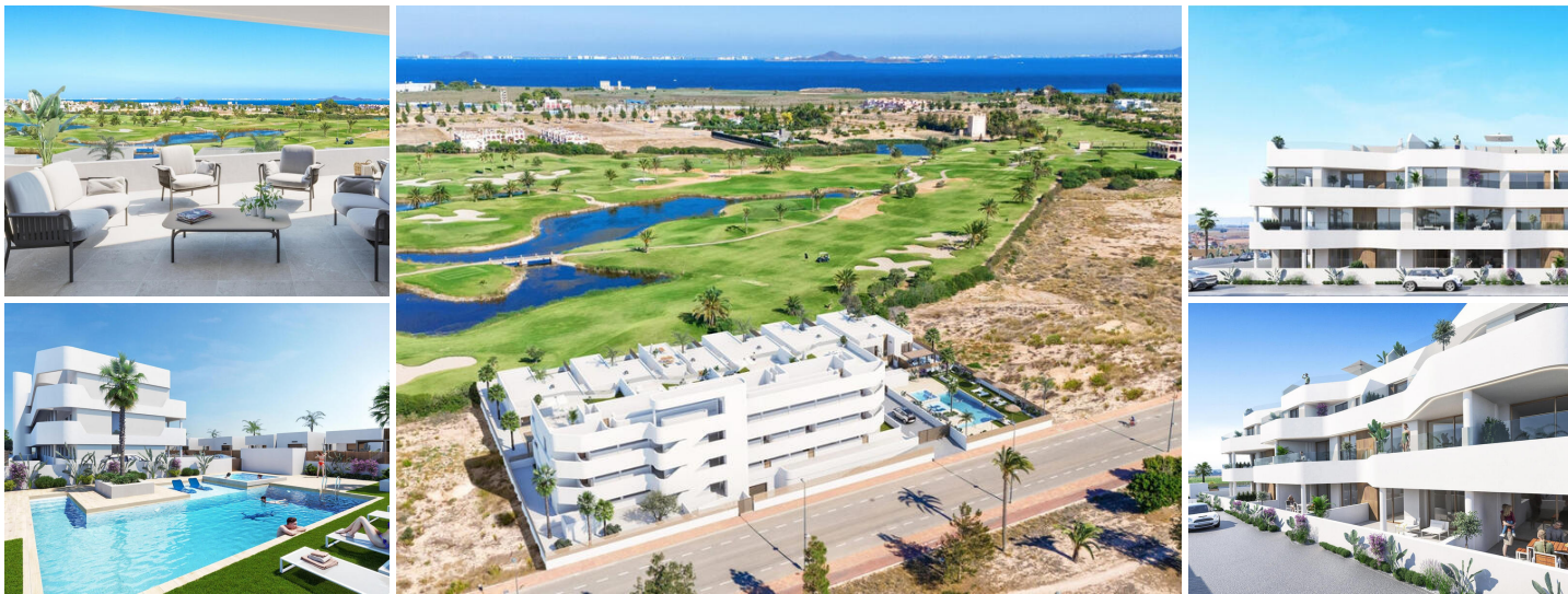
Nybyggt bostadskomplex i Los Alcazares

Los Alcázares är en idyllisk plats för dem som vill investera i ett nytt bostadsområde på Costa Cálida. Bara 25 minuter från Murcia flygplats och cirka 55 minuter från Alicante flygplats, är detta område bekvämt anslutet med motorväg till större städer som Cartagena, Murcia och Alicante, liksom till andra vackra stränder längs Costa Cálida och Costa Blanca.