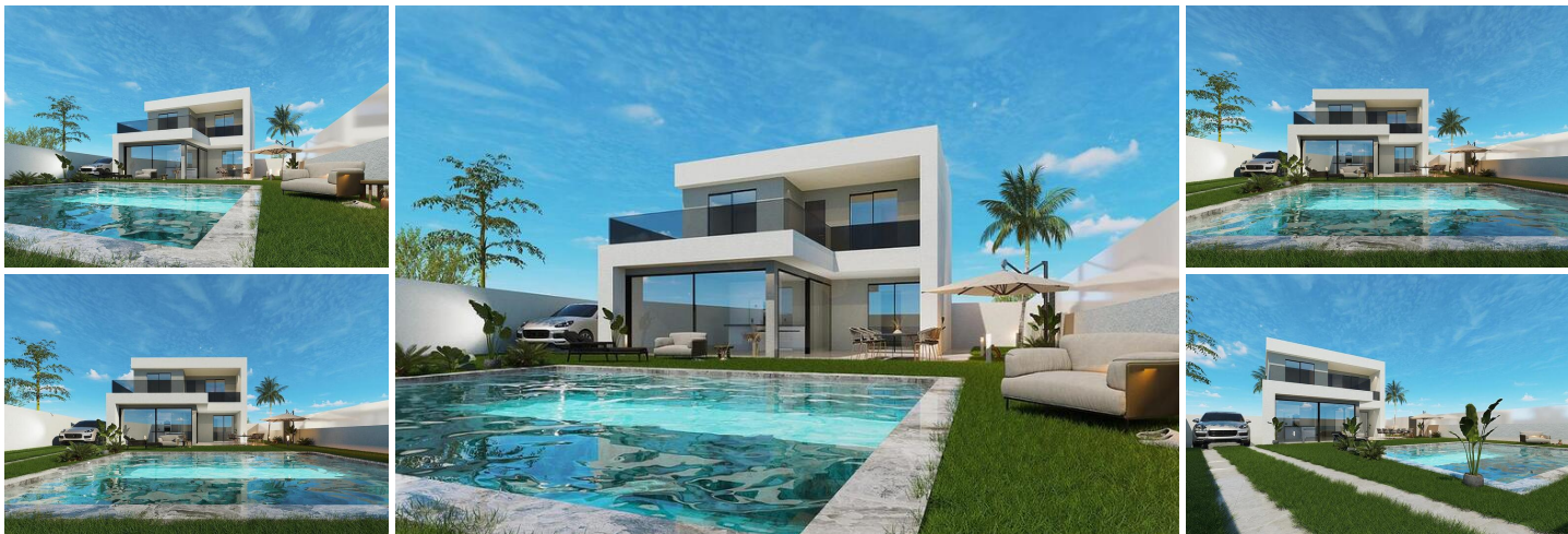
NYBYGGD VILLA I SAN PEDRO DEL PINATAR

Nybyggd vacker villa i två plan har blivit omtänksamt utformad för att ge det perfekta individuella privata moderna vardagsrummet, med dubbla skjutdörrar i helglas som öppnar direkt mot en stor terrass med privat pool slutna trädgårdar med parkering utanför vägen. "SUN ALL DAY" med terrasserad yta på första våningen för att njuta av solen hela dagen ... Beläget i ett centralt, etablerat bostadsområde bara 10 minuters promenad till stränderna i San Pedro del Pinatar.