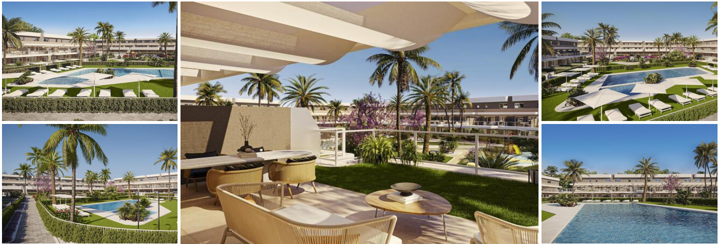
NYBYGGT BOSTADSKOMPLEX I ALENDA GOLF, ALICANTE

Nybyggd privat anläggning med vackra lägenheter med 2 och 3 sovrum och stora terrasser med utsikt över det trevliga gemensamma området, kombinerar det lugna området Alenda Golf Course med ett mer livligt nattliv vid stranden som är lättillgängligt på bara 15 minuter.