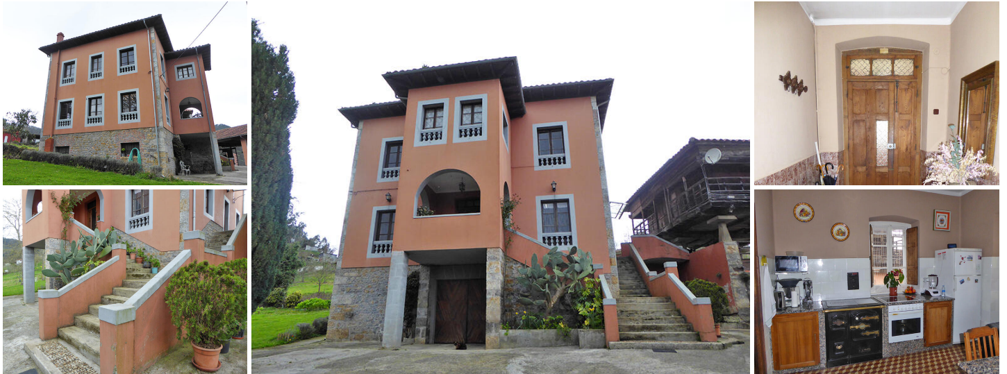
Отдельный дом в Астурии

Большой отдельный семейный дом на продажу недалеко от Саласа в Астурии. Этот пятикомнатный дом расположен в небольшой деревне между Корнельяной и Саласом и готов к заселению. Недвижимость находится в очень хорошем состоянии, местами требуется лишь небольшая покраска. Этот внушительный дом также идет с участком земли площадью 6125 квадратных метров с несколькими взрослыми деревьями, панерой, большим открытым амбаром, дополнительной кладовой, гаражом, несколькими заброшенными стойлами для скота и небольшим домом для восстановления. Это много недвижимости за такую цену. Также есть дополнительный гектар земли, который можно купить за 24 000 евро, если кто-то заинтересован в покупке большего количества. Он расположен всего в нескольких минутах ходьбы от окраины деревни и следует за рекой Ноная.