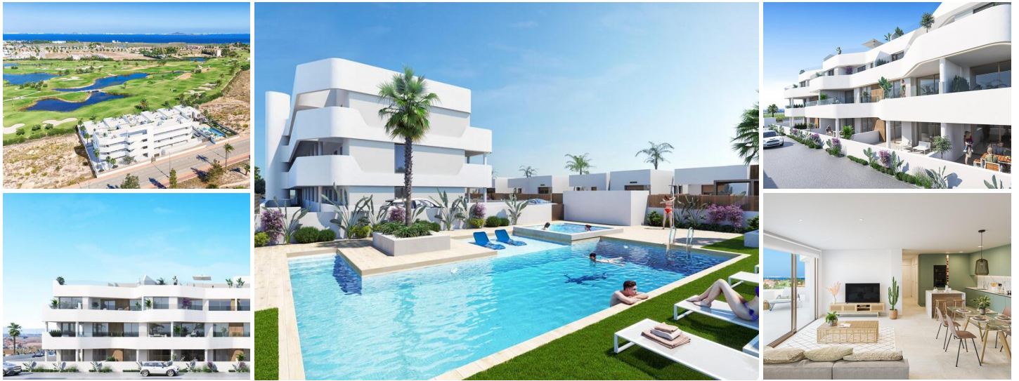
Новый жилой комплекс в Лос-Алькасаресе

Лос-Алькасарес - это идиллическое место для тех, кто хочет инвестировать в новую жилую недвижимость на побережье Коста-Калида. Всего в 25 минутах езды от аэропорта Мурсии и примерно в 55 минутах от аэропорта Аликанте, этот район удобно связан автомагистралями с такими крупными городами, как Картахена, Мурсия и Аликанте, а также с другими прекрасными пляжами на побережье Коста Калида и Коста Бланка.