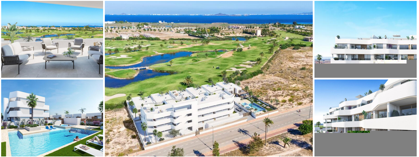
Новый жилой комплекс в Лос-Алькасаресе

Лос-Алькасарес - это идиллическое место для тех, кто хочет инвестировать в новую жилую недвижимость на побережье Коста-Калида. Всего в 25 минутах езды от аэропорта Мурсии и примерно в 55 минутах от аэропорта Аликанте, этот район удобно связан автомагистралями с такими крупными городами, как Картахена, Мурсия и Аликанте, а также с другими прекрасными пляжами на побережье Коста Калида и Коста Бланка.