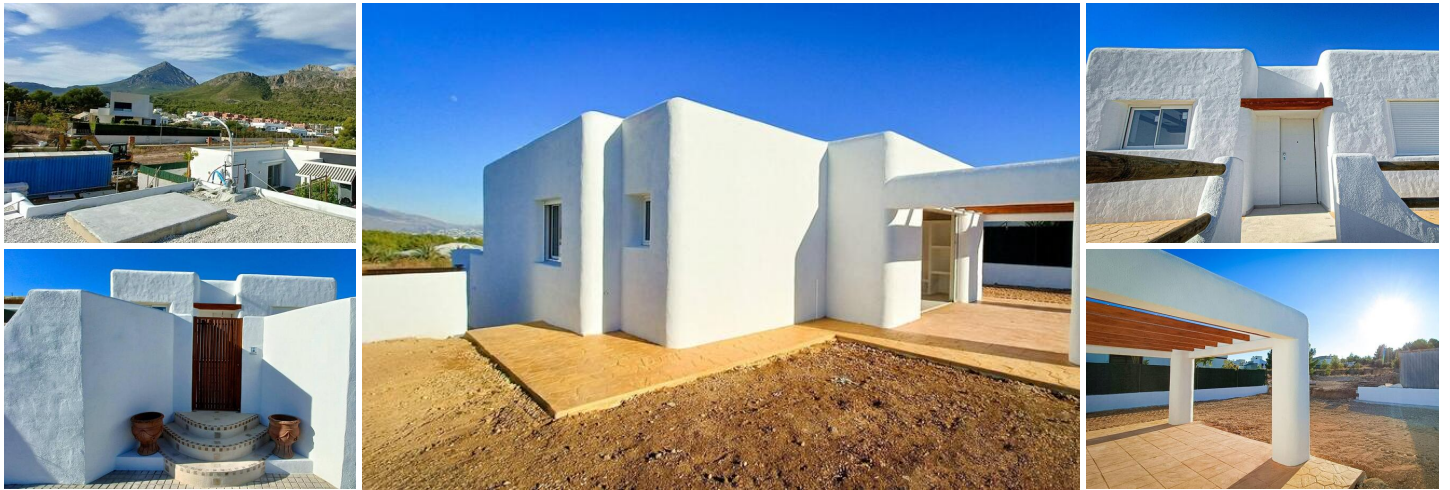
NYBYGD VILLA I IBIZA-STIL I POLOP

Denne nybygde eksklusive villaen i Ibiza-stil ligger på en privilegert tomt i Polop, med fantastisk utsikt over fjellet og havet.