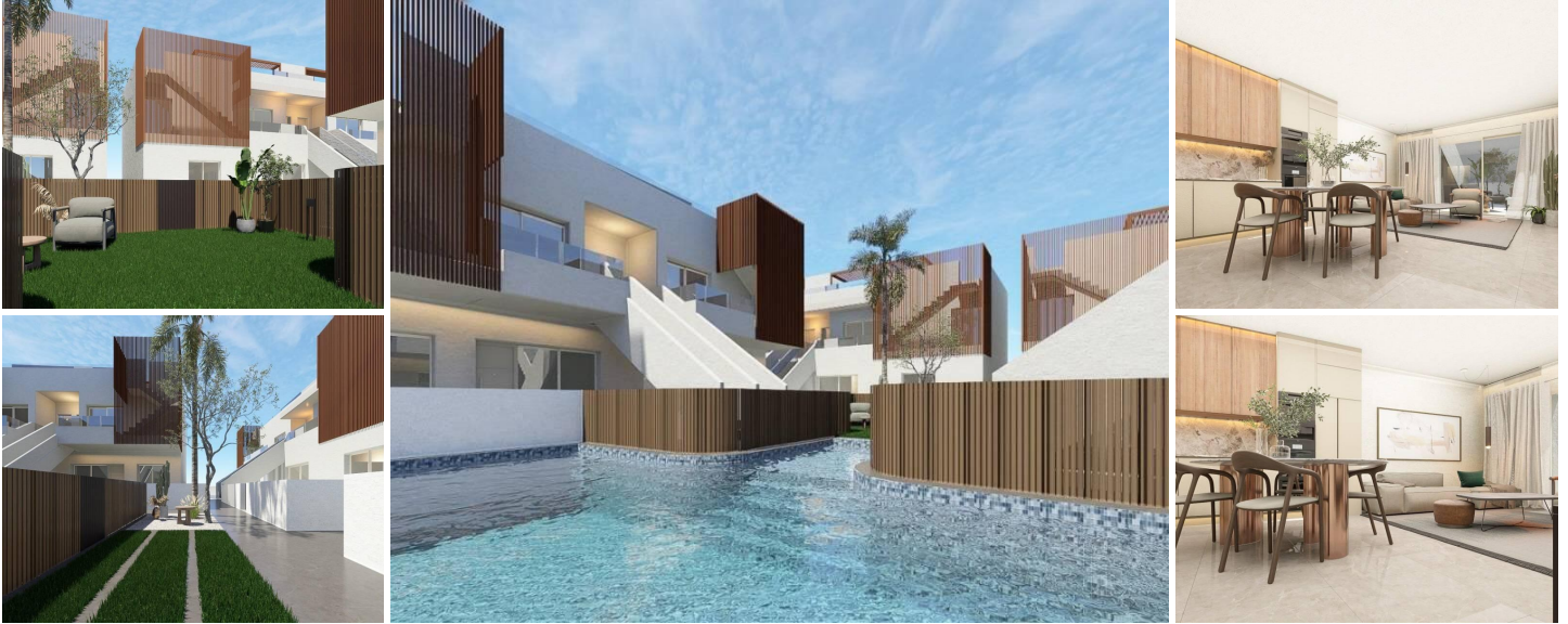
Nieuwbouw Bungalows met gemeenschappelijk zwembad in Pilar de la Horadada - Costa Blanca Zuid

Moderne woningen dicht bij het strand en het stadscentrum