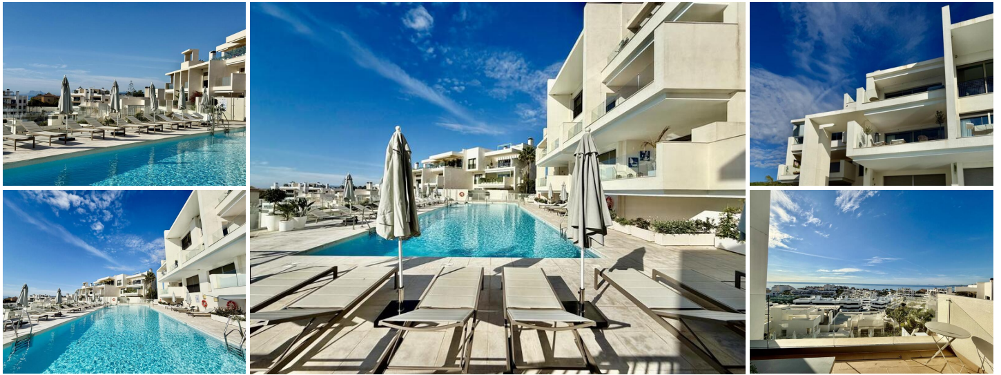
Ongeëvenaard Uitzicht in Estepona – Modern Appartement met 3 Slaapkamers en 3 Badkamers

Ontdek adembenemende panoramische uitzichten op zee en de bergen vanuit dit ruime appartement met 3 slaapkamers en 3 badkamers, perfect gelegen in de gewilde wijk Las Mesas in Estepona. Met uitzicht op de kust, Gibraltar en Marokko biedt deze prachtige woning een rustige, maar gunstige locatie, net boven de jachthaven van Estepona, op loopafstand of een korte rit van de oude binnenstad, het strand en de levendige nieuwe boulevard.