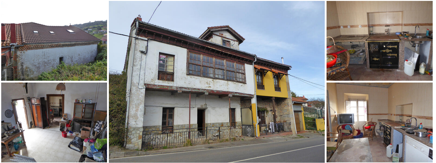
Dorpshuis in La Peral

Dorpshuis om te restaureren en een stuk bouwgrond in La Peral. Dit pand heeft een paar jaar geleden al wat restauratiewerkzaamheden ondergaan. Er is een nieuw dak geplaatst en de elektriciteit en het loodgieterswerk zijn allemaal vervangen. Er is ook wat werk uitgevoerd op de eerste verdieping, waarbij nieuwe vloerplanken en een nieuwe badkamer zijn geïnstalleerd, maar geen van beide klussen is afgerond. Dit is dus een gedeeltelijke renovatie, voornamelijk intern werk, maar er zouden ook nieuwe ramen nodig zijn. Voor de prijs is dit echter een koopje, omdat het ook 1500 m 2 bouwgrond achter het pand omvat, met toegang voor auto's en een geweldig uitzicht.