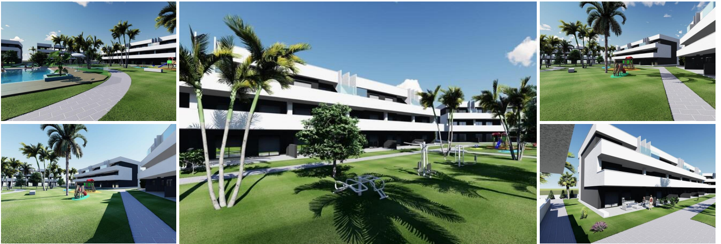
Nieuwbouw wooncomplex in el raso

Nieuwbouw gesloten wooncomplex met toeristische appartementen in El Raso, Guardamar del Segura.