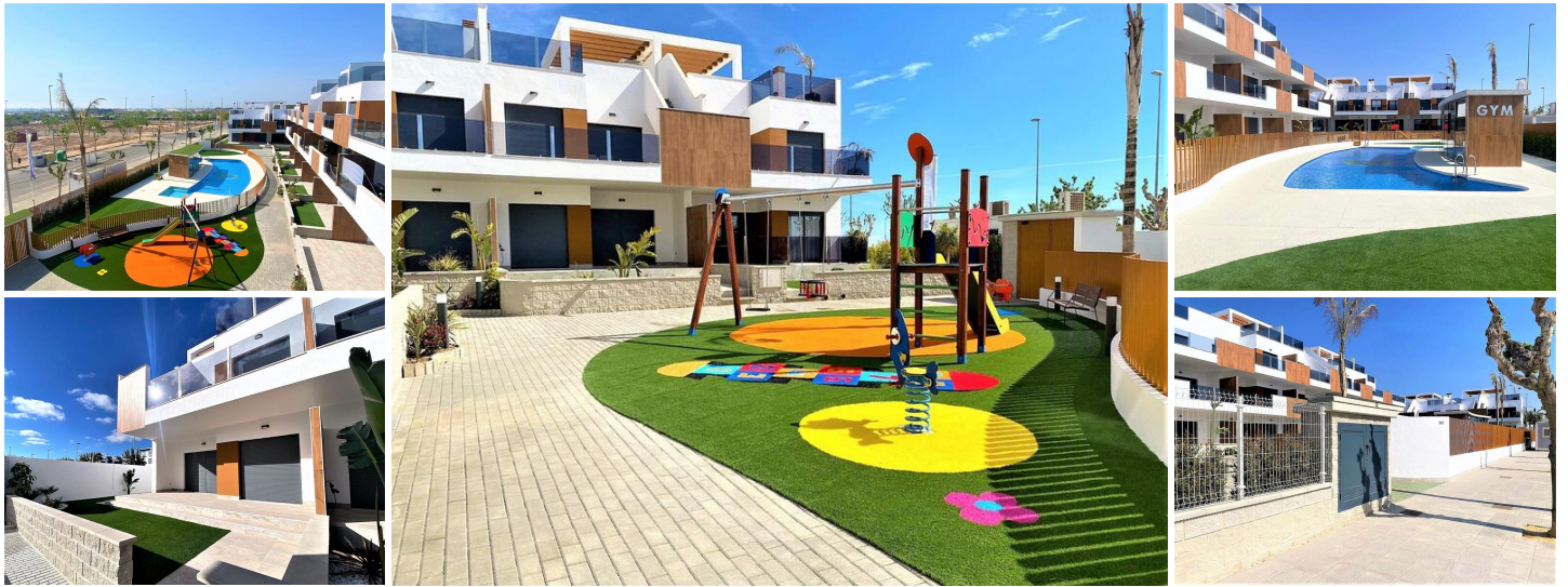
Nieuwbouw wooncomplex in pilar de la horadada

nieuwbouw wooncomplex in moderne stijl bestaat uit bungalows, appartementen en penthouses heeft een grote gemeenschappelijke tuin met zwembad, fitnessruimte en speeltuin voor de kinderen.