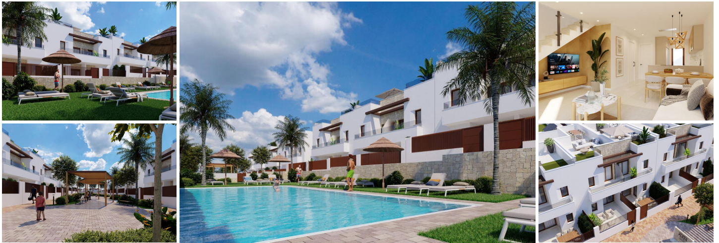
Nieuwbouwwoningen in Vistabella Golf Resort, Orihuela

Exclusieve residentiële ontwikkeling op een toplocatie