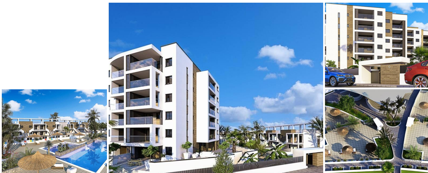
Nieuwbouw appartementen en bungalows in Mil Palmeras