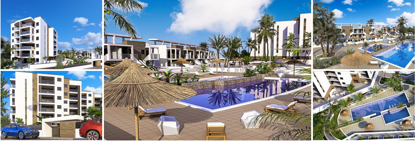
Nieuwbouw appartementen en bungalows in Mil Palmeras