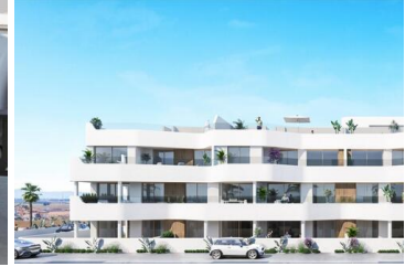
Nieuwbouw wooncomplex in Los Alcazares

Los Alcázares is een idyllische locatie voor wie wil investeren in een nieuwe woning aan de Costa Cálida. Dit gebied ligt op slechts 25 minuten van de luchthaven van Murcia en ongeveer 55 minuten van de luchthaven van Alicante en is via de snelweg goed verbonden met grote steden als Cartagena, Murcia en Alicante, maar ook met andere prachtige stranden langs de Costa Cálida en de Costa Blanca.