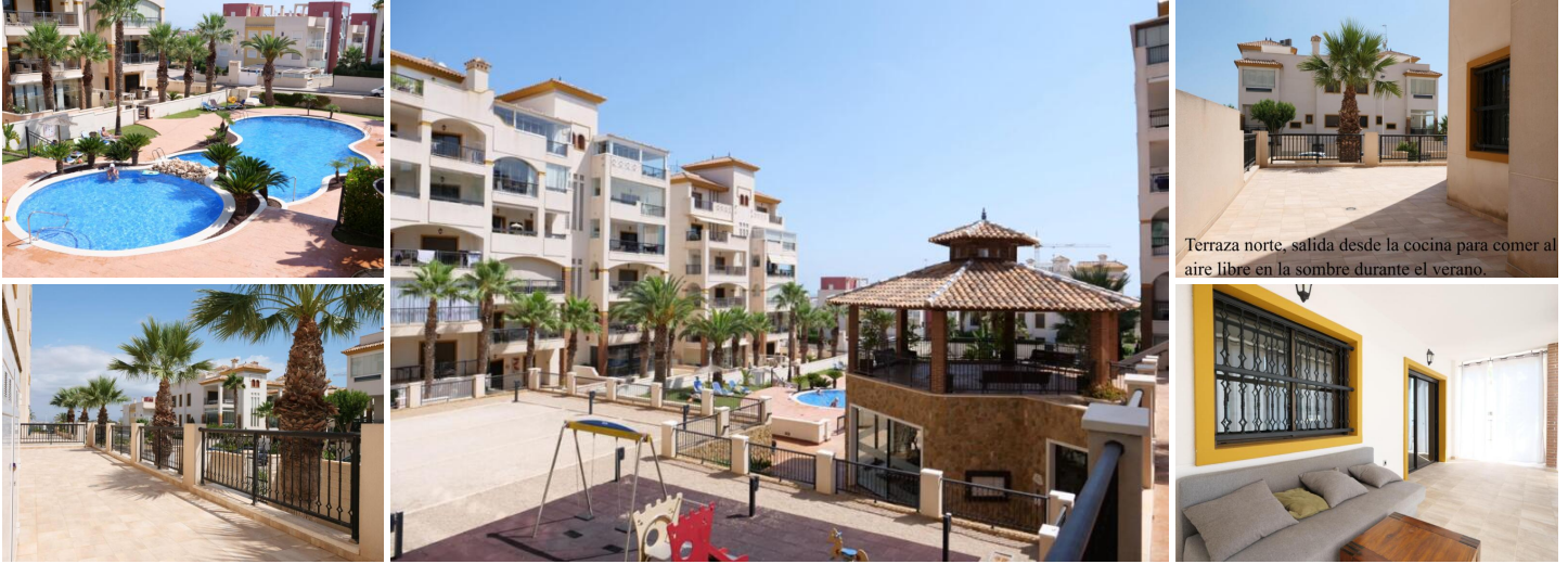
Terraza norte, salida desde la cocina para comer al aire libre en la sombra durante el verano.