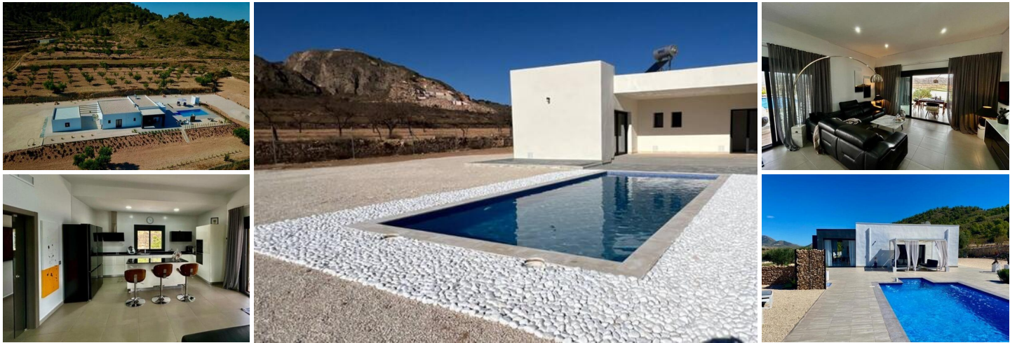
NIEUWBOUW VILLA IN ALBANILLA, MURCIA

Nieuwbouw villa op een groot perceel in de gemeente Abanilla, provincie Murcia.