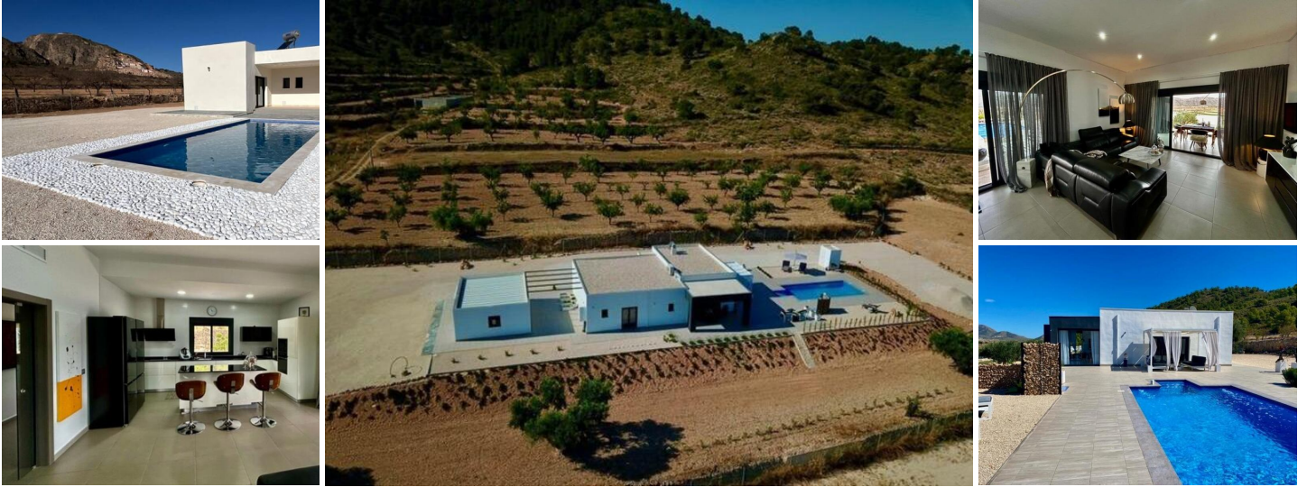
NIEUWBOUW VILLA IN ALBANILLA, MURCIA

Nieuwbouw villa op een groot perceel in de gemeente Abanilla, provincie Murcia.