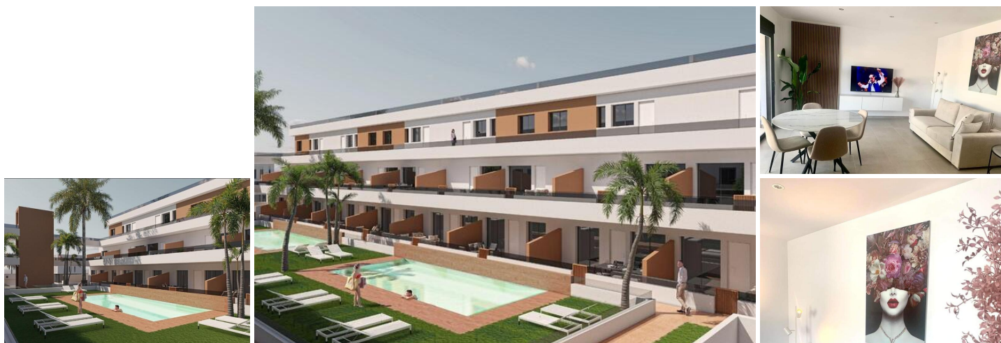
NIEUWBOUW WOONCOMPLEX IN PILAR DE LA HORADADA

Nieuwbouw wooncomplex met appartementen en penthouses in Pilar de la Horadada.