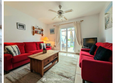
Las Palmeras Suzy

Mooi herenhuis gelegen in Mojacar Playa in de rustige woonwijk die bekend staat als El Palmeral, op zeer korte loopafstand (30 meter) van het strand en voorzieningen. Het dichtstbijzijnde strand is Playa del Descargador. Ook een korte wandeling naar het commerciële centrum.