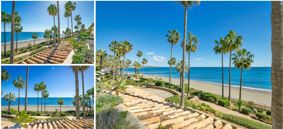
Adembenemend Hoekappartement met Panoramisch Zeezicht – URB. DOMINION BEACH

Welkom in dit prachtige hoekappartement met 3 slaapkamers en 2 badkamers in het prestigieuze URB. Dominion Beach. Deze uitzonderlijke woning biedt ongeëvenaard frontaal zeezicht en is zorgvuldig gerenoveerd om design, luxe en functionaliteit naadloos te combineren.