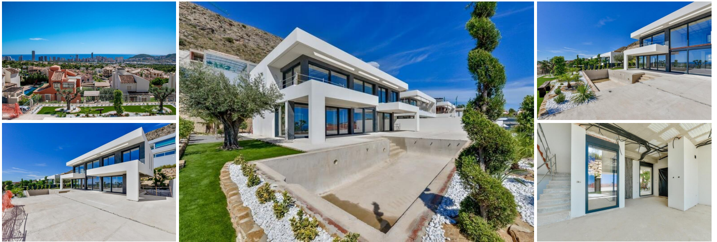
NIEUWBOUW LUXE VILLA IN FINESTRAT MET UITZICHT OP ZEE

Nieuwbouw luxe villa met zeezicht in Sierra Cortina, Finestrat.