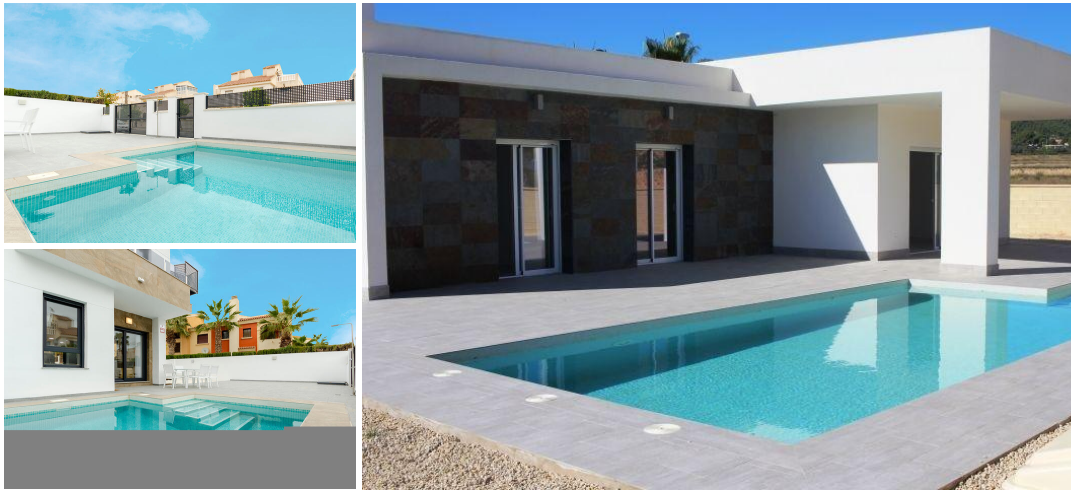
VILLA TUSSEN ZEE EN BERGEN

Fantastische nieuw gebouwde villa op een perceel van 500m 2 in La Romana.