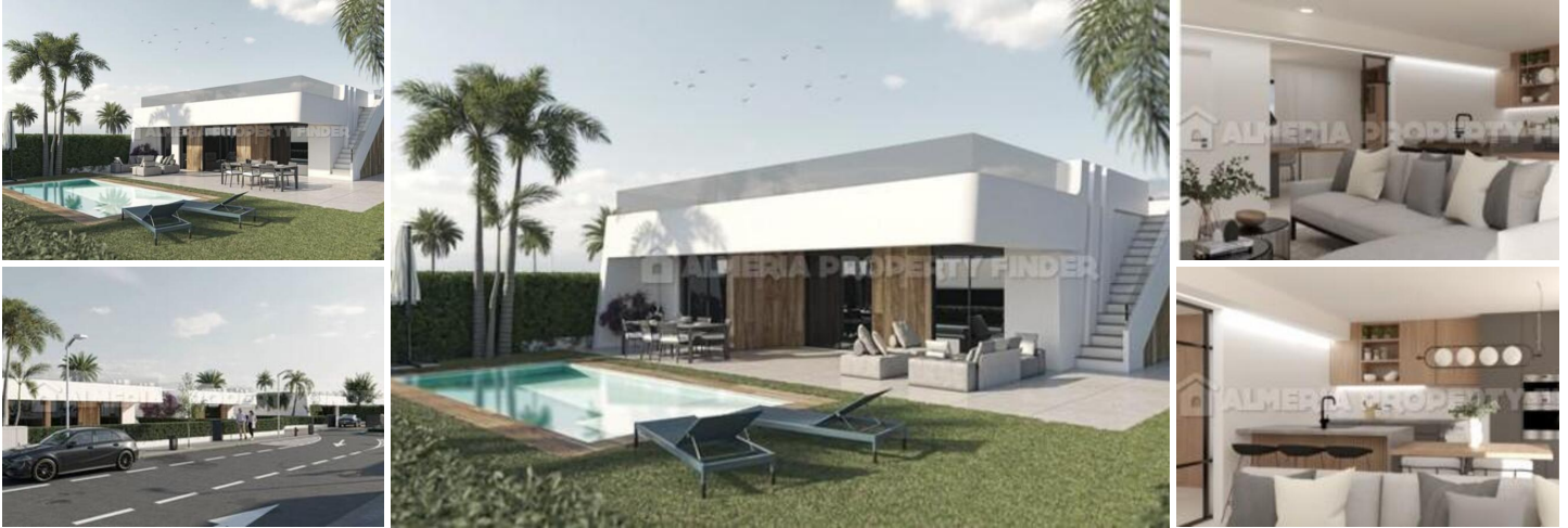
Alhama Nature Resort - Atenea II - Villa nr. 6

Luxe villa met 92,91 m 2 bebouwde oppervlakte, 254,21 m 2 perceeloppervlakte, 11,20 m 2 terras, 142,90 m 2 tuin, 94,20 m 2 solarium, woonkamer, keuken, 3 slaapkamers, 2 badkamers met douche, 2 toiletten, pre -installatie van airconditioning, zwembad, parkeerplaats