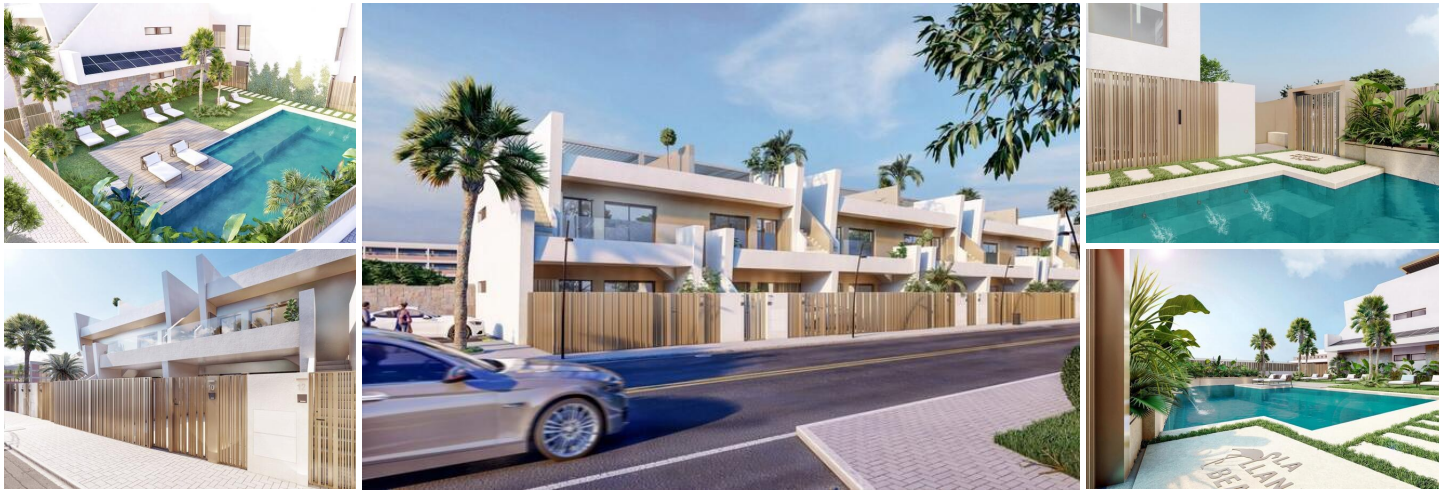
BUNGALOW BEGANE GROND IN SAN PEDRO DEL PINATAR

Volledig ingerichte woning, op slechts twee minuten lopen van het centrum van de stad San Pedro del Pinatar.