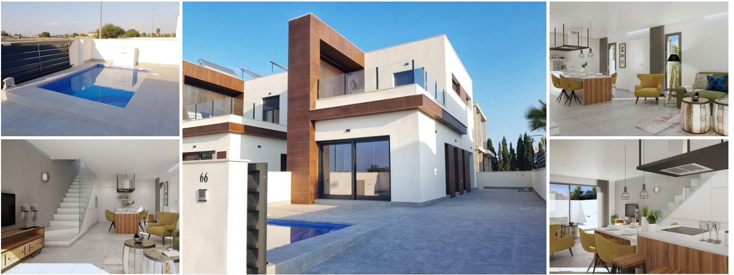
Nouvelles villas jumelées à daya nueva

nouvelles villas jumelées dans le nouveau quartier de Daya Nueva. A quelques minutes à pied du centre de la ville.