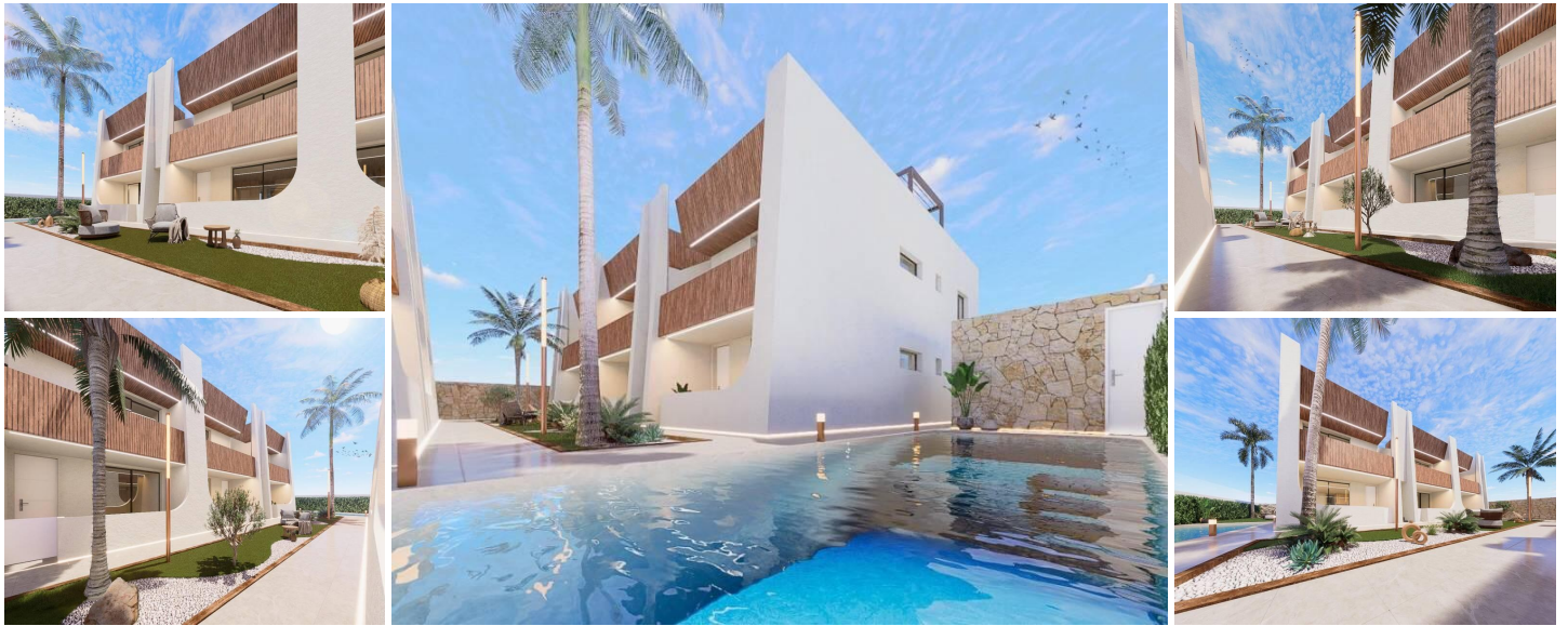
BUNGALOWS DE CONSTRUCTION NEUVE A SAN PEDRO DEL PINATAR

Nouveau complexe résidentiel d'appartements de plain-pied à San Pedro del Pinatar.