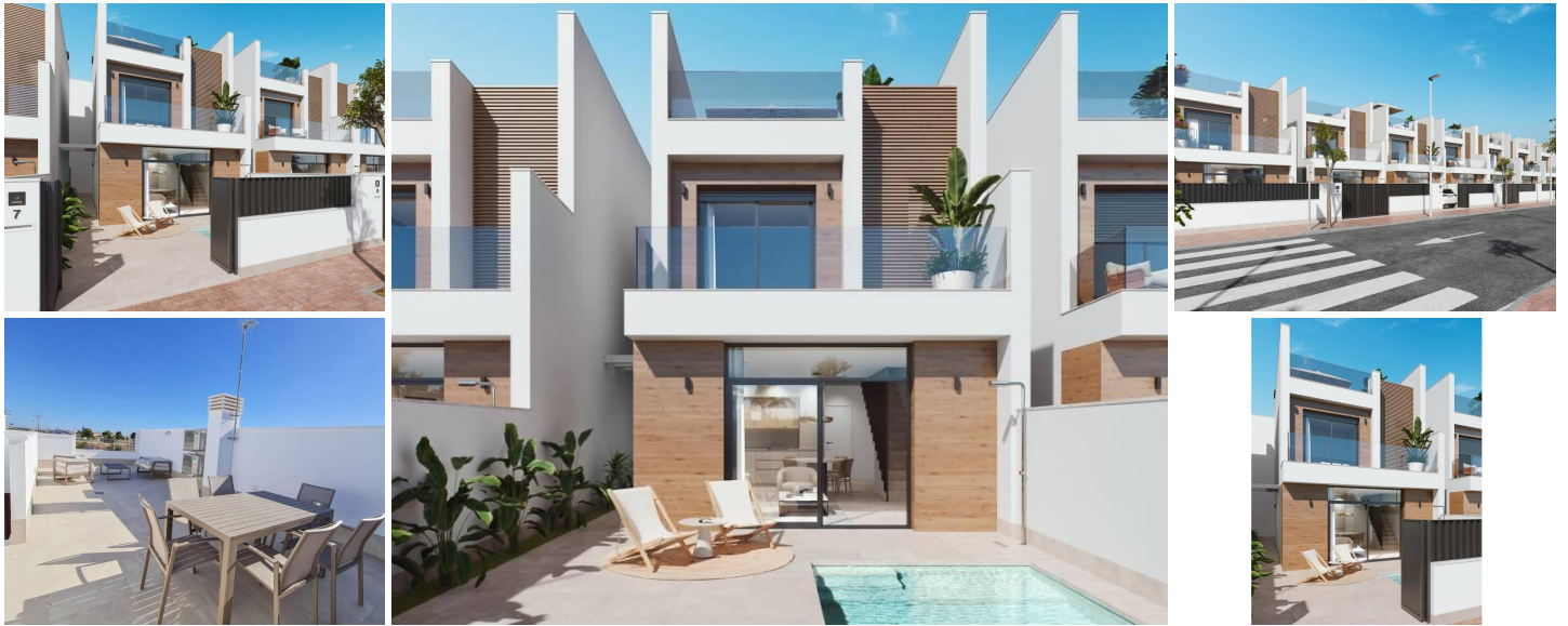
VILLAS NEUVES A SAN PEDRO DEL PINATAR

Nouveau développement de villas et de maisons de ville à San Pedro del Pinatar, Murcia.