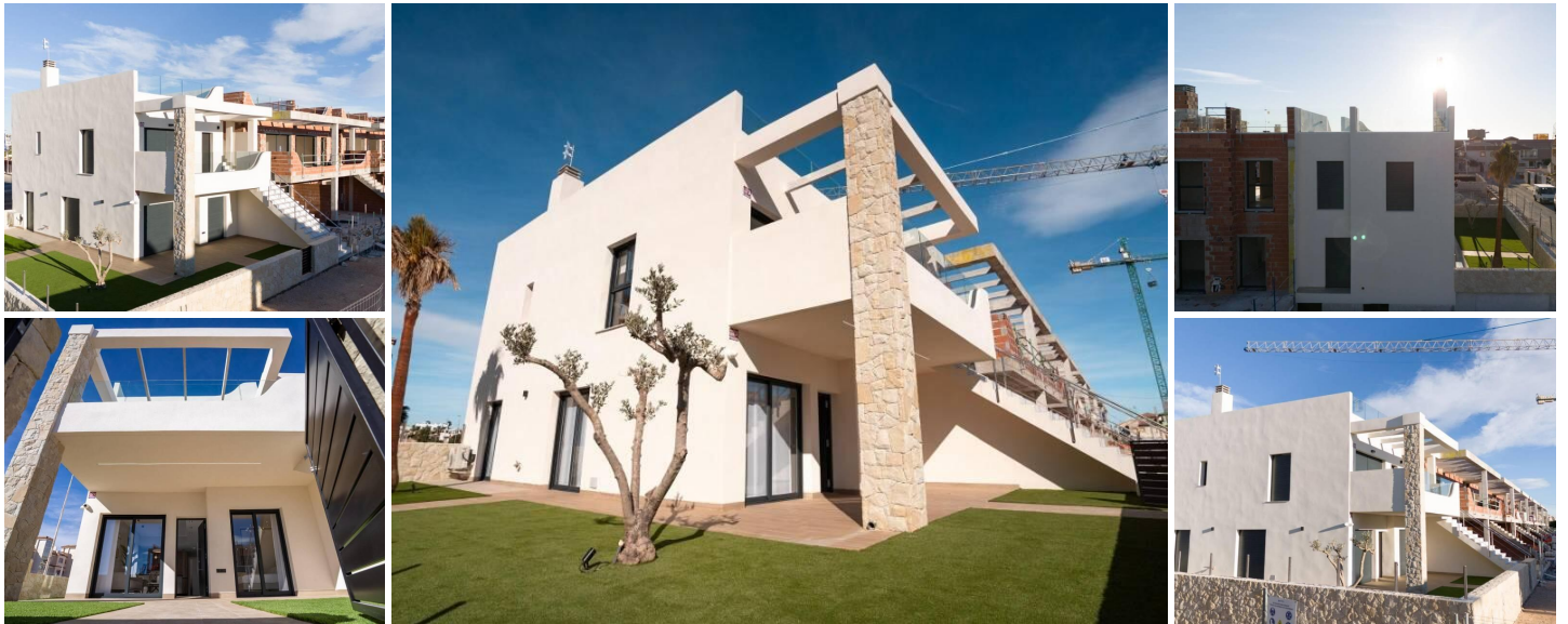
Villas et bungalows neufs à Pilar de la Horadada