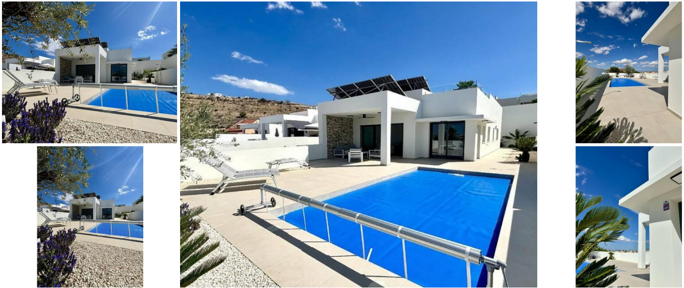
Villas méditerranéennes neuves à Benijófar