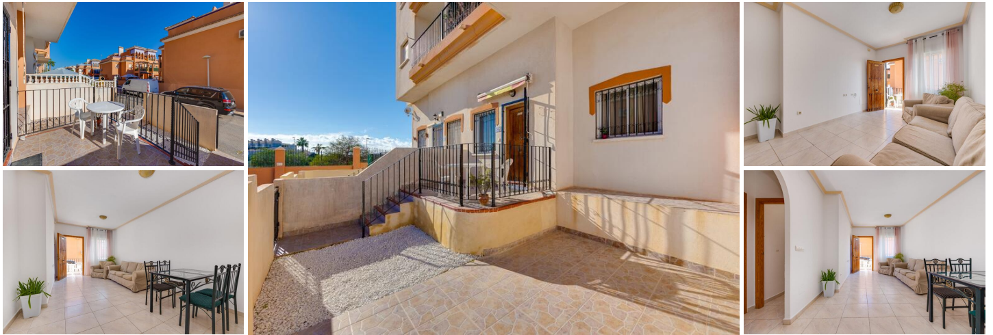
Bel appartement à Playa Flamenca, Orihuela Costa

Appartement en rez-de-chaussée avec une spacieuse terrasse avant de 23m 2 . La propriété dispose de 2 chambres, 2 salles de bains, d'un salon-salle à manger lumineux et d'une cuisine ouverte, répartis sur 78m 2 . Elle comprend également un patio intérieur et une place de parking sur la parcelle.