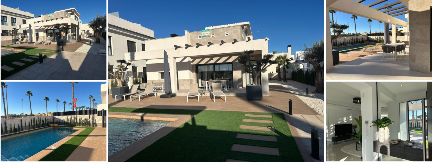
Villa Moderne de Plain-Pied avec Jardin Privé et Solarium à Ciudad Quesada Rojas

Cette magnifique villa neuve, construite en 2024, offre tout ce que vous recherchez : un séjour-salle à manger moderne avec cuisine ouverte, 3 chambres, 2 salles de bains, un grand solarium, un jardin privé, une piscine et un parking. Parfait pour ceux qui recherchent confort, style et intimité.