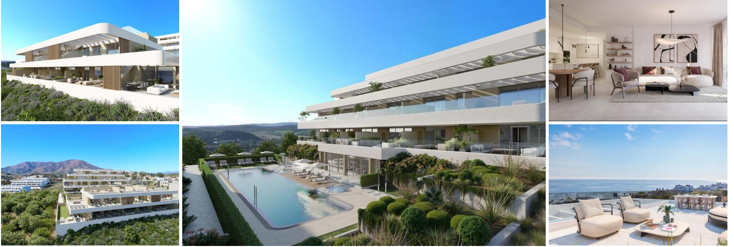
Appartement 1 Chambre avec Vue sur la Mer

Ce complexe résidentiel boutique exclusif propose seulement 25 logements soigneusement conçus, comprenant des appartements d'une, deux et trois chambres, répartis dans deux bâtiments contemporains et décalés. Chaque résidence est orientée vers la mer, baignant les intérieurs de lumière naturelle tout au long de la journée et offrant des vues imprenables sur la côte méditerranéenne.