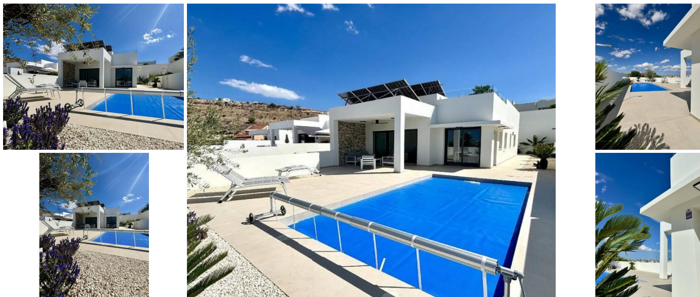
Villas méditerranéennes neuves à Benijófar