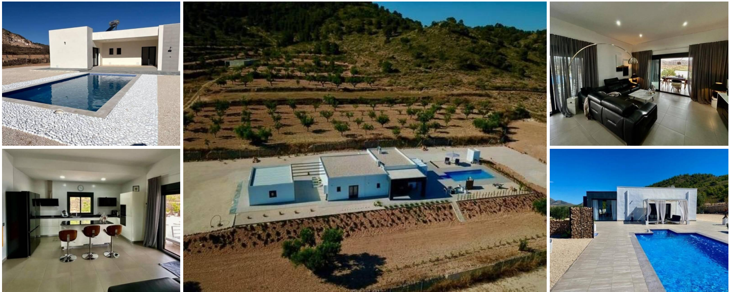
VILLA NEUVE A ALBANILLA, MURCIA

Villa neuve sur un grand terrain dans la municipalité d'Abanilla, province de Murcie.