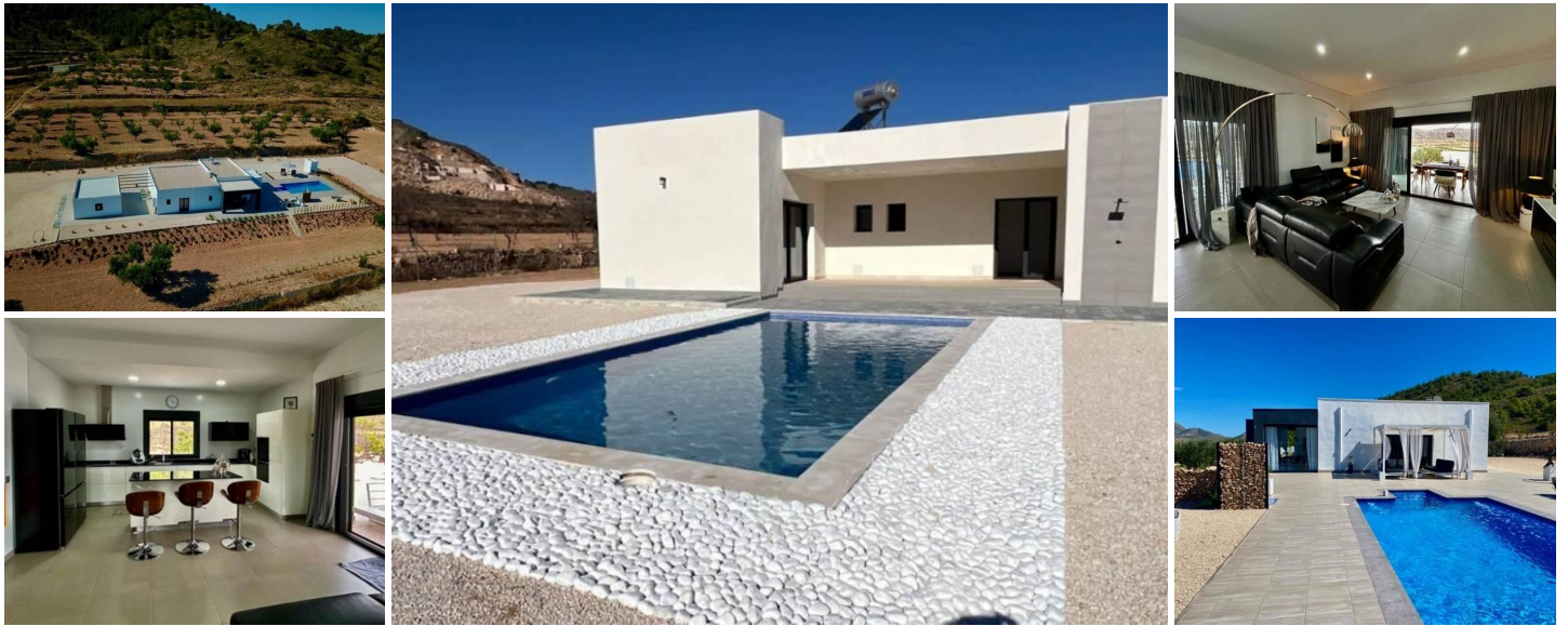
VILLA NEUVE A ALBANILLA, MURCIA

Villa neuve sur un grand terrain dans la municipalité d'Abanilla, province de Murcie.