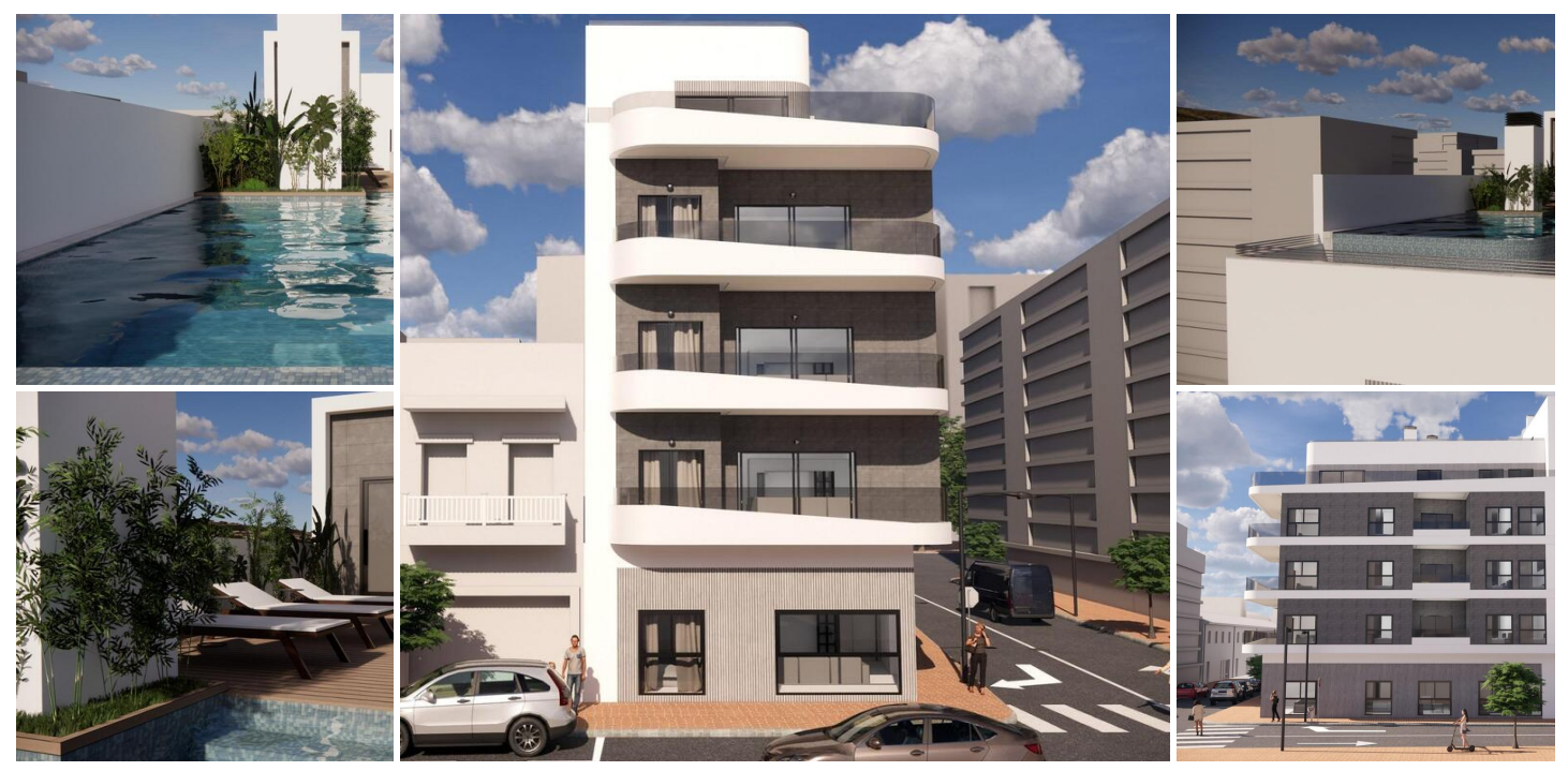
NOUVELLE CONSTRUCTION PENTHOUSE À TORREVIEJA

Nouveau bâtiment magnifique à La Mata, Torrevieja.