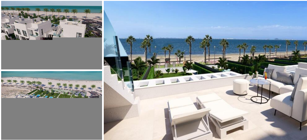
Villas de luxe en construction neuve au bord de l'eau à Los Alcázares

Découvrez le summum de la vie méditerranéenne avec ce projet résidentiel exclusif, comprenant neuf villas contemporaines situées directement sur le front de mer dans la belle ville côtière de Los Alcázares, en Murcie. Situées dans le quartier recherché de Nueva Ribera, ces villas sont conçues pour le luxe, l'intimité et la commodité, avec un accès proche aux terrains de golf, aux centres commerciaux et aux centres de transport. Chaque villa offre des finitions haut de gamme, une vue imprenable sur la mer et une piscine privée, ce qui en fait le choix idéal pour ceux qui recherchent une retraite côtière moderne.