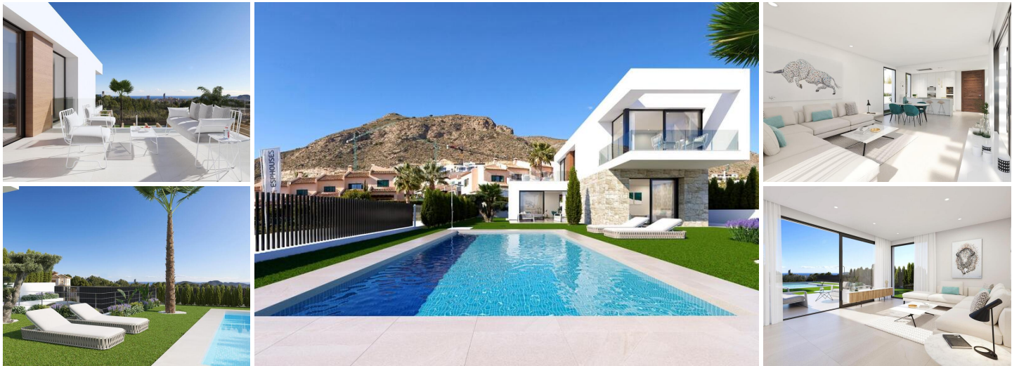
Luxueuses villas neuves à Sierra Cortina, Finestrat

Découvrez l'élégant nouveau développement de villas indépendantes dans le quartier exclusif de Sierra Cortina, à Finestrat. Nichées dans une zone pittoresque proche de Benidorm, ces propriétés haut de gamme offrent des espaces de vie modernes et des équipements de premier ordre. Avec un accès facile à la côte méditerranéenne, ces villas sont idéales pour tous ceux qui recherchent un mélange de luxe, de confort et de commodité. À seulement 5 km du centre-ville animé de Benidorm, ce projet vous place également à une courte distance des principaux points d'intérêt.