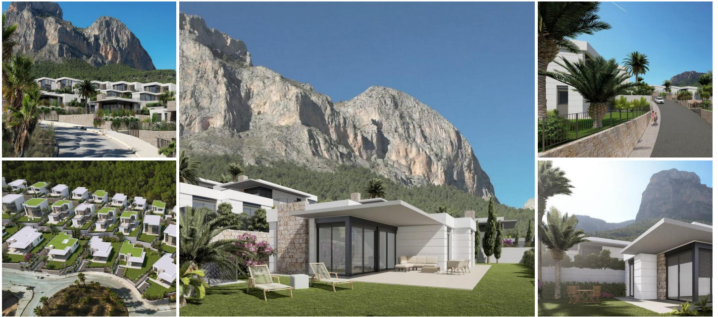
Villas neuves à Polop, Alicante