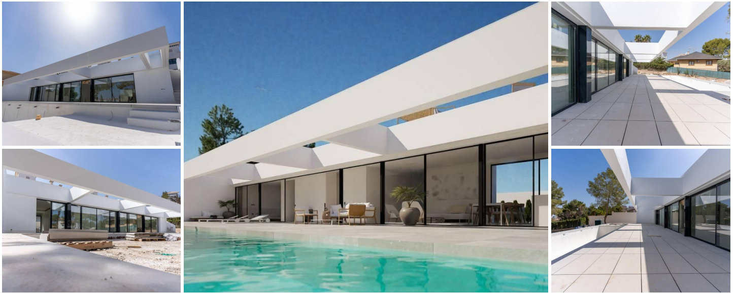
VILLA NEUVE A LAS FILIPINAS

Nouvelle construction spectaculaire villa de luxe construite sur un étage sur un terrain de 1765m 2 , dispose d'une terrasse, solarium privé, grand jardin avec la piscine et un espace de stationnement hors route.