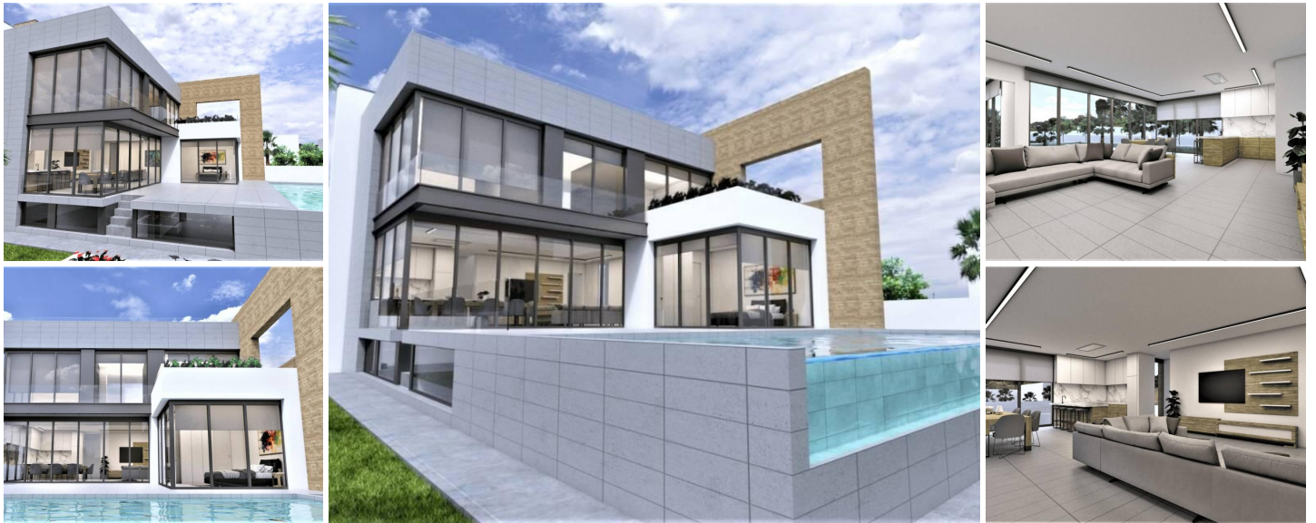
VILLA DE LUXE DE NOUVELLE CONSTRUCTION PRÈS DE LA PLAGE DE LA ZENIA

Nouvelle villa de construction avec vue sur la mer dans la belle région de "La Zenia".