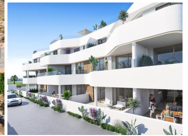
Neubau-Wohnanlage in Los Alcazares

Los Alcázares ist ein idyllischer Ort für diejenigen, die in eine neue Wohnimmobilie an der Costa Cálida investieren möchten. Nur 25 Minuten vom Flughafen Murcia und ca. 55 Minuten vom Flughafen Alicante entfernt, ist diese Gegend über die Autobahn bequem mit den großen Städten wie Cartagena, Murcia und Alicante sowie mit anderen schönen Stränden an der Costa Cálida und der Costa Blanca verbunden.