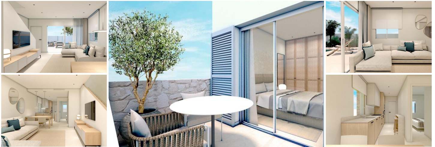
VILLA NEUVE A TORRE DE LA HORADADA

Villa neuve dans un complexe résidentiel avec piscine commune à Torre de la Horadada situé à 800m de la plage.