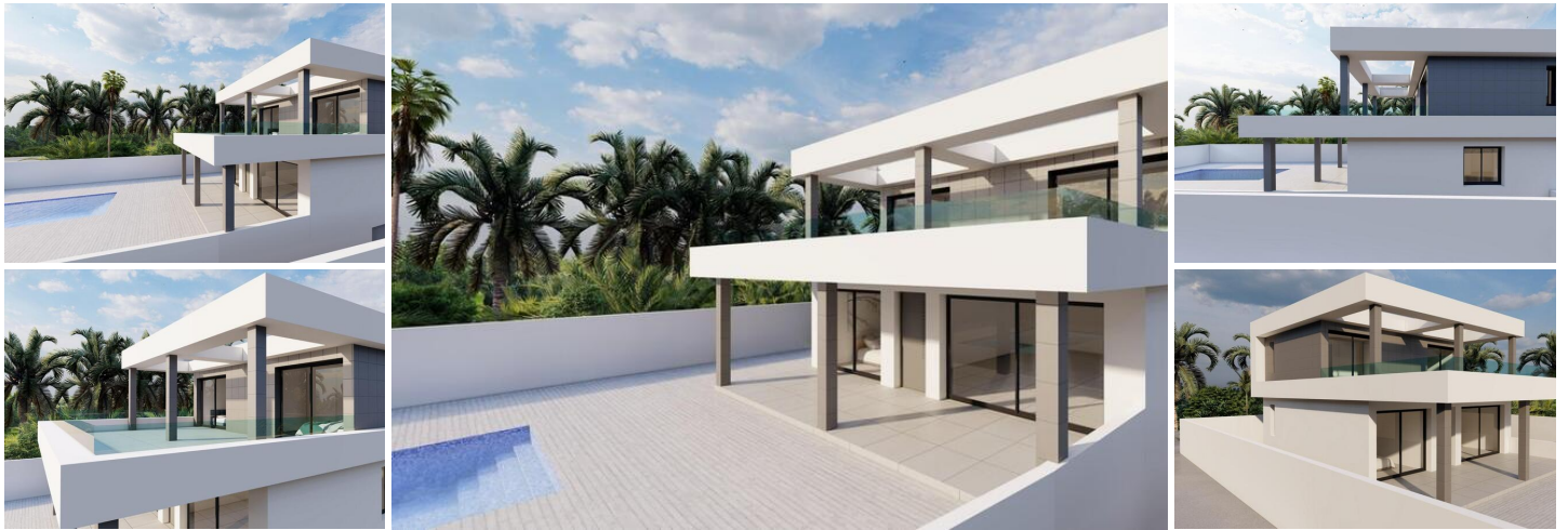
VILLA NEUVE A ROJALES

Villa neuve et moderne à Rojales, proche de toutes les commodités et de tous les services.